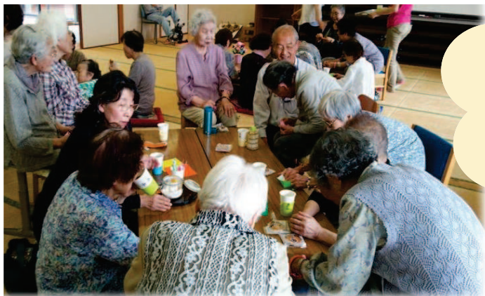
元気カフェ・ぷらっと

子どもから高齢者まで、 日頃から、独りで悩まず 通える場所、 気軽に話せる場所 ～自分の居場所づくり～