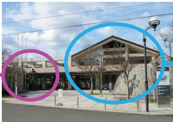
佐々町総合福祉センター